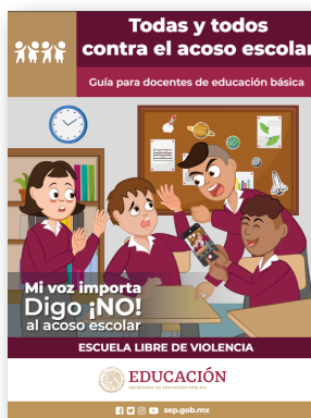
Todas y todos contra el acoso escolar.

https://www.aefcm.gob.mx/normateca/disposiciones_normativas/DGPPEE/archivos-2023/guia_operativa_particulares_2023.pdf