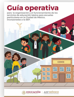
Guía Operativa para el funcionamiento de los servicios de educación básica para escuelas particulares en la Ciudad de México, incorporadas a la SEP

https://drive.google.com/file/d/1QWK5fft08RRUEjO3i3D95o_GCZN-lceyZ/view?ts=661587e8