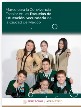
Marco para la Convivencia Escolar en las Escuelas de Educación Secundaria de la Ciudad de México.

Firma del padre de familia de haber recibido indicación de revisar el Marco para la Convivencia Escolar en las Escuelas de Educación Secundaria de la Ciudad De México , la Guía Operativa para el Funcionamiento de los Servicios de Educación Básica para Escuelas Particulares en la Ciudad De México, Incorporadas a la Sep, Todos Y Todas Contra El Acoso Escolar y Orientaciones para la Prevención, Detección y Actuación en Casos De Abuso Sexual Infantil, Acoso Escolar y Maltrato en las Escuelas de Educación Básica.